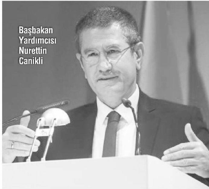
Başbakan Yardımcısı Nurettin Canikli

Siyasi risklerin ve terörün azalmasının ekonomi üzerindeki riskleri de ortadan kaldıracaklarını söyleyen Nurettin Canikli, "Üretim Reform Paketi'nin teknik anlamda tamamlandığını ve uygulamaya geçilmesiyle birlikte birçok problemin ortadan kalkacağını ifade