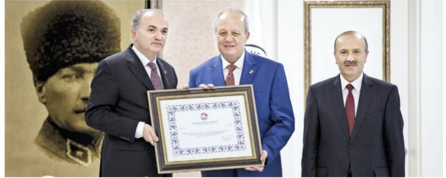
Bakan Özlü, destek sözleşmesini imzalayan Ankara Sanayi Odası (ASO) Başkanı Nurettin Özdebir'e (ortada), sertifikayı takdim etti.

Projelerin sözleşmeleri Bilim, Sanayi ve Teknoloji Bakanı Faruk Özlü'nün katıldığı törenle imzalandı. Özlü, Kümelenme Destek Programı çerçevesinde 5 kümelenme teşebbüsünün desteklenmeye hak kazandığını belirterek "Bu kümelenme teşebbüslerinin 5 yıllık toplam iş planı bütçesi yaklaşık 102 milyon liradır. Bunun yarısını, yani 51 milyon lirasını biz karşılayacağız" dedi. Desteklenmeye değer görülen iş planlarına yüzde 50 hibe verdiklerine işaret eden Özlü "Kümelenme Destek Programı 2'nci destek çağrısına 27 Şubat 2015'te çıktık. Bu çağrıya 16 kümelenme birliğine başvuru bulundu. Birliktelikler içinde, 40 üniversite, 624 firma, 17