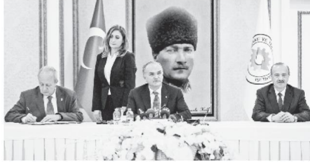
"Kümelenme Destek Programı Sözleşme İmza Töreni", Bilim, Sanayi ve Teknoloji Bakanı Faruk Özlü'nün ev sahipliğinde gerçekleştirildi. Ankara Sanayi Odası (ASO) Başkanı Nurettin Özdebir (solda), destek sözleşmesini imzaladı.

Bakan Özlü işadamlarının kurmak istediği endüstri bölgelerinin devletin kurduğu bütün haklardan yararlanacağını söyledi.