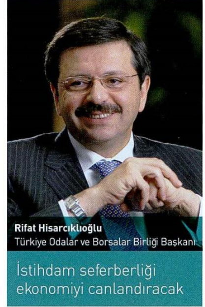
Rifat Hisarcıklıoğlu Türkiye Odalar ve Borsalar Birliği Başkanı

Dünya ekonomisinin 2016'daki yüzde 3,1'lik büyümeden, 2017'de yüzde 3,5'e, 2018'de yüzde 3,6'lık bir büyümeye çıkması tahmin ediliyor. Ekim ayındaki raporda 2017 büyümesi yüzde 3,4 olarak tahmin edilmişti.