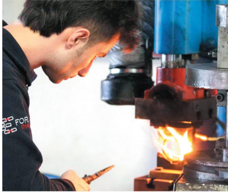
Sanayi sektöründe ise yeni siparişlerde gerçekleşen artışlar, önceki aya göre bir miktar ivme kaybetmiş olmasına karşın üretimdeki artışı destekledi.