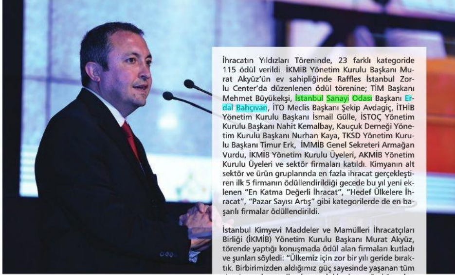
TURKCHEM | Mayıs - Haziran 2017

Türkiye'nin en ihracatçı ilk üç sektöründen biri olan kimya, 2016 yılında 14 milyar dolar ihracat gerçekleştirdi. İstanbul Kimyevi Maddeler ve Mamülleri İhracatçıları Birliği (İKİMİB) geçtiğimiz yıl en fazla ihracata imza atan üyelerini bu başarılarından dolayı ödüllendirdi. Raffles İstanbul Zorlu Center'da düzenlenen İKİMİB 2016 İhracatın Yıldızları Ödülleri töreninde 23 kategoride 115 ödül sahiplerini buldu.