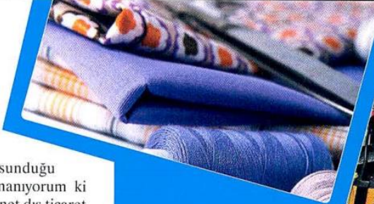
Tuncay ÖZILHAN / Anadolu Grubu Yönetim Kurulu Başkanı

ilk çeyrekte Türkiye'nin mal ve hizmet ihracatı yüzde 10.6 artarken, ithalatta kaydedilen artış ise sadece yüzde 0.8. Atılım yılı olarak ilan ettiğimiz 2017 yılında inaniyorum ki hükümetimiz, attığı birçok olumlu adımla birlikte yapısal reformları da hayata geçirerek çok yakın bir gelecekte çok daha olumlu bir tablonun mimarı olacak. Sanayi sektörü yüzde 5'lik büyüme rakamının da üzerine çıkarak yüzde 5.3 büyüme yakaladı. Sanayi sek-