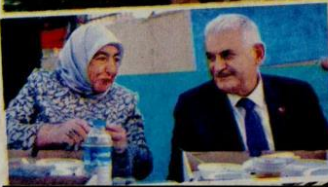
Yıldırım esi ile Gebze'de sokak iftarına katıldı.

Başbakan Yıldırım: Ya adam gibi makul bir faiz oranını benimsersiniz ya da bunun tedbirini alırız. Tehdit olarak algılamayın. Elimizde araçlarımız var.