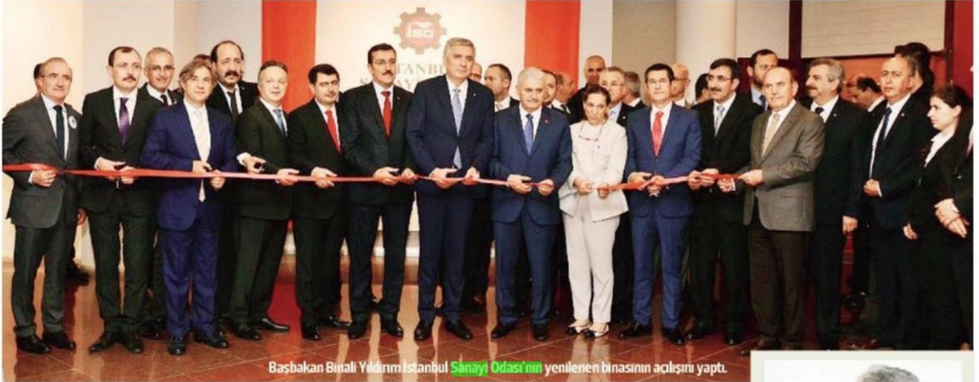
Başbakan Binali Yıldırım İstanbul Sanayi Odası'nın yenilenen binasının açılışını yaptı.

Başbakan Yıldırım, faiz oranlarıyla ilgili olarak bankaları uyardı