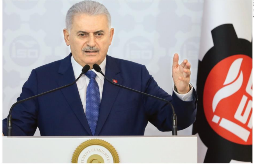
Başbakan Yıldırım, İSO'nun Beyoğlu'ndaki yeni hizmet binasının açılışı ve meclis toplantısında konuştu.

Her şey güzel de bankalar niye faizleri bu kadar yüksek tutuyor. Yüzde 14'ten parayı toplayacaksınız, sanayiye, iş adama kaçtan kullanacaksınız? Yüzde 18,19,20 inansaftıysa 25'e kadar gidiyor. Bu sürdürülebilir bir şey değil. Bunu daha önce bir vesileyle söyledim. Bu hareketten önce son çağrıdır, bak açık söylüyorum; İSO'nun toplantısında söylüyorum. Tren kalkıyor hareketten önce son çağrını yapıyorum ya adam gibi makul bir faiz oranını benimsersiniz veya biz bunun tedbirini alınız. Bunu bankacılarımız bir tehdit olarak algılamasın. Elimizde araçlarımız var. Ellerinden parayı falan alacak değiliz. Aracımız olduğunu bilsinler. İstiyoruz ki doğal seyrinde işler düzelsin. Nasıl kredi garantisi fonuyla kaynak üretseyek, diğer tedbirlerimizle iş alemini rahatlatırsak, bankalar da çaresiz diye düşünmesinler. İstiyoruz ki bu, tatlılıkla olsun. Şimdi bu hükümet, bu kadar yükünü aldı, temerrütle düşecek kredilerini yeniden yapılandırdı, sizi rahatlatı, rasyolarınız arttı, karlarınız uçtu gitti. Bizde bir tabir var; el eli yıkar, el de döner yüzü yıkar. Şimdi yüz yıkama zamanıdır. Bankaların görevlerini yapmalarını sanayiciler adına bekliyoruz. Çok da zamanımız yok. Çünkü hepimiz aynı gemideyiz yani böyle bir kar sanayide var mı? Yok. Çalış, çabala, terle, akıl teri, alın teri... Sonun-