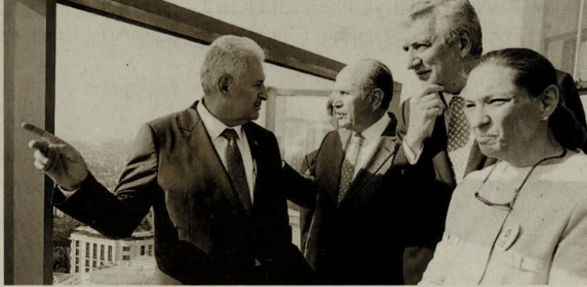
Yıldırım, İBB Başkanı Kadir Topbaş, Erdal Bahçivan ve Zeynep Bodur Okyay, Invest In Istanbul'un açılışını yaptı.

• Tren kalkıyor, hareketten önce son çağrımı yapıyorum; ya adam gibi makul bir faiz oranını benimsersiniz veya biz bunun tedbirini alırız. Bunu bankacılarımız bir tehdit olarak algılamasın. Elimizde araçlarımız var, o araçları kullanmaktan