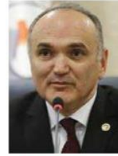
Bilim Sanayi ve Teknoloji Bakanı Faruk Özlü

Bu kapsamda sanayi sitesi yapı kooperatiflerince, il özel idarelerince, büyükşehir belediyelerince veya belediyelerce yapılacak sanayi sitelerinin idari ve sosyal tesis binaları, arsa bedelleri, mülkiyetin edinilmesi masrafları ile altyapı ve üstyapı