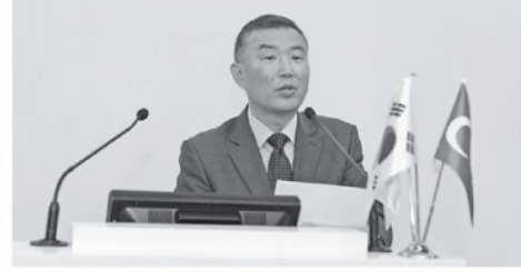
Güney Kore İstanbul Başkonsolosu Young-Cheol CHA

berilemeli. Güney Kore'de sağlıklı besinlere artan bir talep var ve Türkiye bu alanda çok zengin. Aynı şekilde başarılı olduğunuz tekstil,