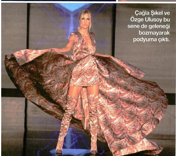
Çağla Şikel ve Özge Ulusoy bu sene de geleneği bozmayarak podyuma çıktı.