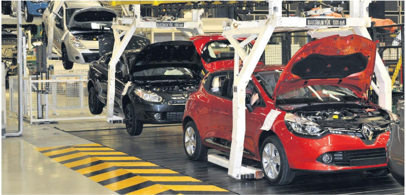
Motor vehicle exports in 2017 had the highest exports with $23.9 billion, while overall exports recorded the second-highest figures in Turkey's history, hitting $157.1 billion.

In 2017, Turkey's exports hit $157.1 billion, the second-highest in history, surpassing the $156.5 billion goal set in the Medium Term Plan