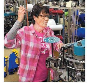
Yurtdışı yeni siparişler istihdamı da artırdı.

ceki aya göre hızlandı hem de son altı yılın en yüksek düzeyinde gerçekleşti. Firmalar satın alma faaliyetlerini daha da artırdı ve bu artış birikmiş işlerini azaltmalarına yardımcı oldu. Satın alma faaliyetlerindeki artış tedarikçilerin teslim sürelerinin uzamasına da neden oldu. Yeni siparişlerdeki güçlü eğilim, firmaları aralık ayında satın alma faaliyetlerini artırmaları konusunda cesaretlendirdi. Girdi ahımlarındaki artış da girdi stoklarının tıhlı düzeyde yükselmesine katkı sağladı. Ancak nihai ürün fiyatları enflasyonu önceki aya kıyasla geriledi.