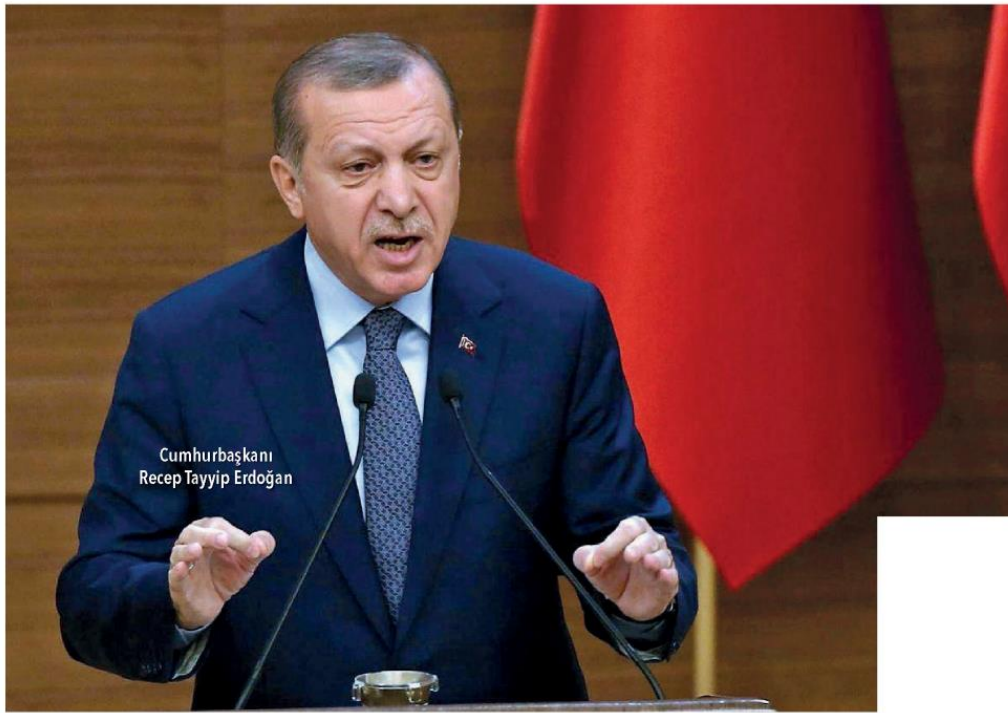
Cumhurbaşkanı Recep Tayyip Erdoğan

Cumhurbaşkanı Recep Tayyip Erdoğan, 24 Haziran 2018'de erken seçime gidileceğini açıkladı. MHP Genel Başkanı Devlet Bahçeli'nin partisinin Salı günü grup toplantısında yaptığı konuşmasında, "26 Ağustos'ta erken genel seçim yapılсын" çağrısı gündeme bomba gibi düşmüştü. Çarşamba günü Cumhurbaşkanı Erdoğan, MHP Genel Başkanı Devlet Bahçeli'yi kabul etti.