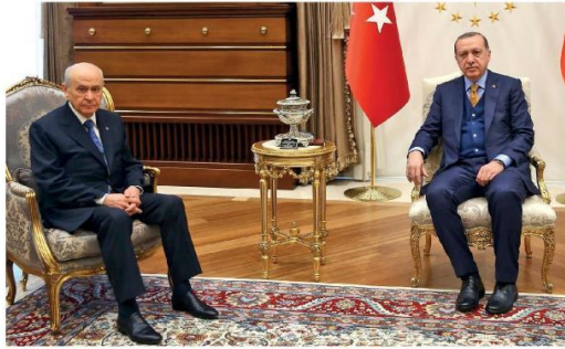
H.Merkezi / E.Çözüm

Cumhur İttifakı/Türkiye'yi erken seçime götürme konusunda uzlaştı. MHP Genel Başkanı Devlet Bahçeli ile bir araya gelen Cumhurbaşkanı Recep Tayyip Erdoğan, 24 Haziran 2018 Pazar günü erken seçime gidilmesi yönünde karar aldıklarını açıkladı.