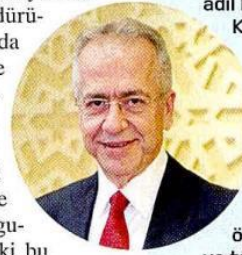
Erol BİLECİK / TÜSİAD Başkanı