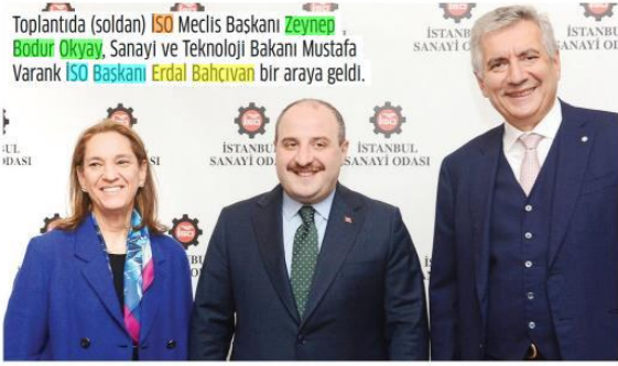
Toplantıda (soldan) ISO Meclis Başkanı Zeynep Bodur Okyay, Sanayi ve Teknoloji Bakanı Mustafa Varank ISO Başkanı Erdal Bahçıvan bir araya geldi.