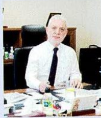
Birol KÜLE / Rekabet Kurumu Başkanı

PANDEMİDE tüm dünyada olduğu gibi ülkemizde de e-ticaret ve perakende sektörü gibi bazı sektörler öne çıktı. Önümüzdeki dönemde bu alan Rekabet Kurumu’nun gündeminde daha fazla yer tutacak. Piyasalardaki güncel gündemi takip ederken ekonomide esaslı dönüşüm yaratan dip dalgayı, veri ekonomisini ve dijital dönüşümü elbette ihmal etmiyoruz. Türkiye’de bu alanda en etkin kurumlardan biri olarak yıllardır veri ekonomisinin sektörlerdeki dönüştürücü etkisini yakından takip ediyor ve bu alanda tüketici refahını bozacak piyasa