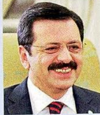
Rifat HİSARCIKLIOĞLU / Türkiye Odalar ve Borsalar Birliği Başkanı

SALGIN hem toplumsal hem de iktisadi hayatı derinden etkiledi. Küresel ekonomide yakın tarihin en ciddi şoku yaşandı. Üretim, tüketim ve ticaret aynı anda düştü. Dünya ekonomisinin 2020’de yüzde 4’ün üzerinde daralması bekleniyor. Bu oran 2009 küresel krizinden bu yana dünya ekonomisindeki en derin daralma olarak kayda geçiyor. Ülkemizdeyse salgına ve beraberinde gelen kısıtlamalara rağmen, 2020 yılının pozitif büyüme ile kapatılacağı bekleniyor. 2021’de Türkiye’nin karşısındaki temel risk alanları olarak kamu maliyesinde