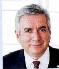
Erdal BAHCIVAN / İstanbul Sanayi Odası Başkanı

SANAYİCİLER olarak pandeminin çok edici ilk günlerinde dahi ülkemize karşı sürdürdüğümüz üretim sorumluluğumuzu bugün de sürdürüyoruz. Bu süreçte istediğimiz performansı yakalayabilmemiz için ajandamızda bulunan üç temel konuda atılması gereken adımlar var. Bunlardan biri ve en önemli finansal istikrar. Hem mevcut işletmelerin döndürülmesi açısından hem de bizi bekleyen yeni yatırımların oluşturulabilmesi açısından sanayicinin en önemli stres kaynaklarından birisi bu olacak. İkinci önemli konu istihdam.