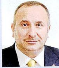
Ali KOPUZ / İstanbul Ticaret Borsası Başkanı

2020 yılında pandemi kaynaklı sorunların çözümüne odaklandık. Tabii böylesi olağanüstü koşullar, olağanüstü önlemler gerektirir. İş dünyasının taleplerinin hükümetimiz tarafından can kulağı ile dinlenilmesi ve kabul görmesi bizleri sevindiriyor. Ben bu çabanın, 2021’de ekonomiye olumlu yansıtacağını düşünüyorum. Zira birçok ülke rekor sayılabilecek daralmalar açıklarken ikinci çeyrekte pandemi dolayısıyla yaşanan küçülmeyi, beklentileri aşan üçüncü çeyrek büyümesi ile adeta bertaraf ettik. Bu olumlu sürecin 2021’de de süreceğine