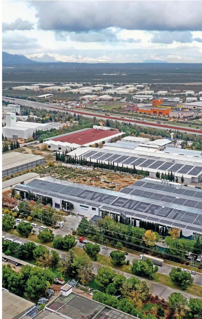
CW Enerji Mühendislik, a Turkish renewable energy solutions company, has started producing electricity via solar panels installed on the roof of a building in an industrial zone in the Mediterranean province of Antalya.

The Turkish Lira rallied 1.5 percent to its strongest since August 2020 yesterday, and a risk gauge dropped to close to