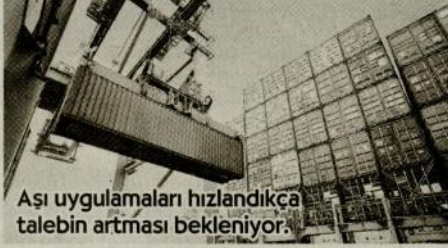
Aşı uygulamaları hızlandıkça talebin artması bekleniyor.

İstanbul Sanayi Odası (İSO) Türkiye İmalat Sektörü İhracat İklimi Endeksi'nin Ocak 2021 sonuçları, ihracat iklimindeki bozulmaya işaret etti.