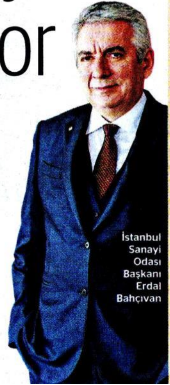
Istanbul Sanayi Odası Başkanı Erdal Bahçivan