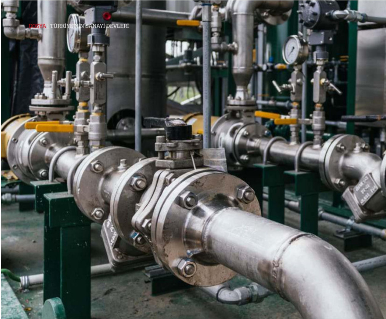
DÜNYA | TÜRKİYE'NİN SANAYİ DEVLERİ

belirleyici olmayı sürdürdü. Erdal Bahçivan , "2020 yılında Covid-19 salgını ile oluşan finansal koşullar içinde Türk lirasındaki değer kaybı, enflasyondaki artış ve faiz oranlarındaki dalgalanmalar sonucunda bir önceki yıla göre finansman yükü önemli ölçüde arttı. 2020 yılında ISO 500 'ün finansman giderleri yüzde 39,2 artışla 88,8 milyar TL'ye yükseldi. Bununla birlikte, faaliyet karı yüzde 55'lik artışla 142,8 milyar TL'ye çıktı ve bu sayede finansman giderlerinin faaliyet karına oranı yüzde 69,3'ten yüzde 62,2'ye geriledi. Yaşanan bu görece iyileşmeye rağmen, sanayi kuruluşları ana faaliyetlerinden elde ettikleri karların halen oldukça önemli bir bölümünü finansman giderlerine ayırma-ya devam etti" diye konuştu.