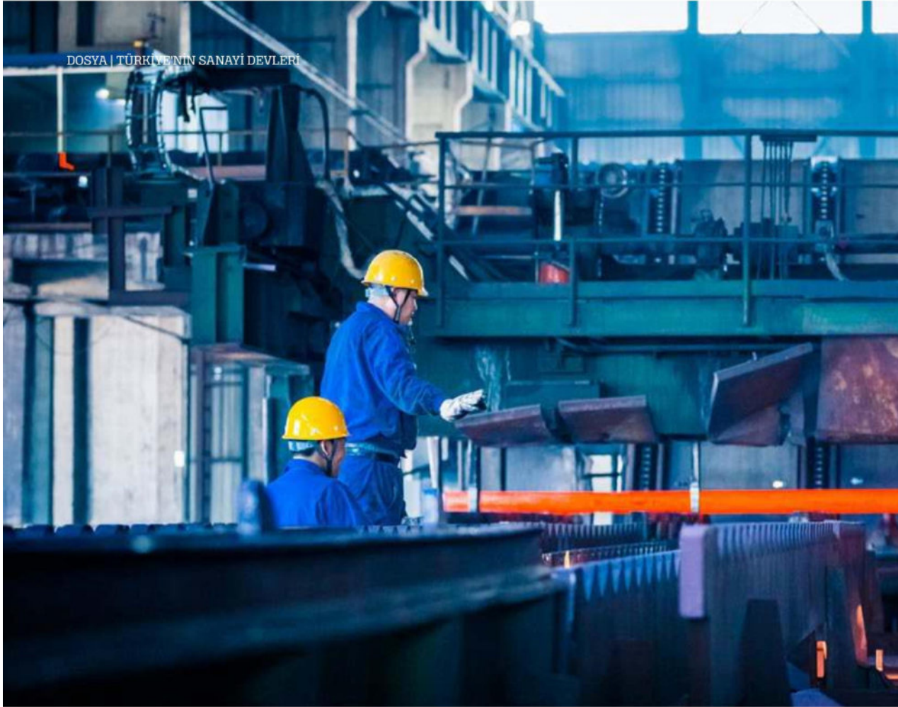
DOSYA | TÜRKİYE'NİN SANAYİ DEVLERİ

Türkiye'nin 2020'deki Sanayi Devleri belli oldu. İSO 'nun Türkiye'nin 500 Büyük Sanayi Kuruluşu 2020 Araştırması'na göre, TÜPRAŞ, üretimden satışlarda 58,6 milyar lirayla en büyük sanayi kuruluşu oldu. Ford Otomotiv 45,2 milyar lirayla ikinci, Oyak-Renault Otomobil Fabrikaları ise 31,2 milyar lirayla üçüncü sırada.