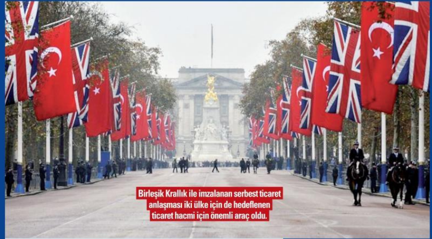
Birleşik Krallık ile imzalanan serbest ticaret anlaşması iki ülke için de hedeflenen ticaret hacmi için önemli araç oldu.

Öz, "Her iki ülkede ticaret yapan şirketlerin zarar görmemesi ve ticaretlerin devam ettirebilmesi adına imzalanan STA, iki ülke tarafından ileriye dönük, sağlam temelli bir ticaret geleceğinin hazırlanmasına yardımcı olacaktır." ifadelerini kullandı. Öz, Türkiye'nin, özellikle Asya'da bulunan üretim alanlarının Avrupa'ya daha yakın konumda olması, uygun maliyet ve kalitede hizmet sunabilmesi ile ilgi odağı olmaya devam ettiğine işaret ederek, "İki ülkenin karşılıklı olarak, ticaret anlamında birbirinden öğrenebileceği ve destek alabileceği çok şey olduğunu göz önüne alırsak, imzalanan ve daha da genişleyecek olan Serbest Ticaret Anlaşması, her iki ülke için de hedeflenen ticaret hacmine ulaşmada en önemli araç olacak" dedi.