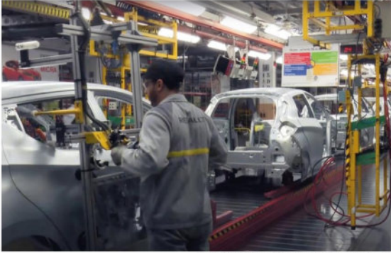
Ekran görüntüsü Renault Group tanıtım videosundan alınmıştır.