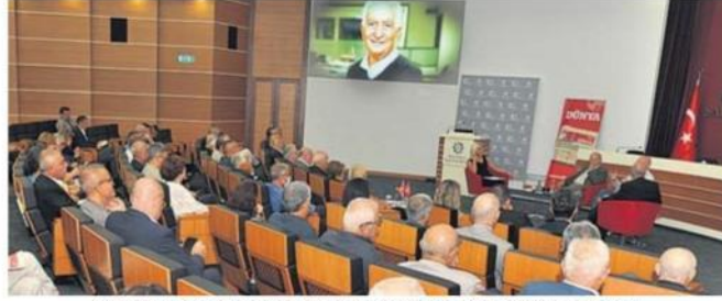
Güngör Uras'ı anma etkinliği iş dünyası ve ekonomi basınına buluşturdu.

"Güngör Uras, gazeteciler için olduğu kadar biz sanayiciler için de değerli bir ağabeydi. Üretim aşkını en iyi