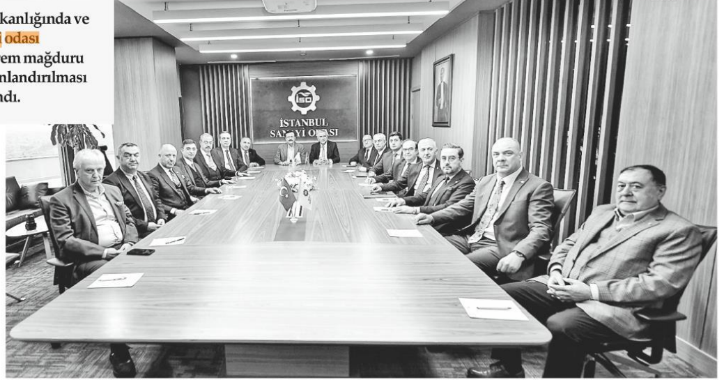
TOBB bünyesindeki 12 sanayi odasının başkanları, TOBB Başkanı M. Rifat Hisarcıklıoğlu başkanlığında ve İstanbul Sanayi Odası'nın ev sahipliğinde, depremden etkilenen 11 ilin ekonomilerinin yeniden canlandırılması amacıyla bir araya geldi.

İstihdamın ve ekonomik aktivitenin yeniden canlandırılması, hasar gören üretim tesislerinin tekrar faaliyete başlayabilmesi için oda ve borsalar vasıtasıyla ve üyelerimizin katkılarıyla teknik destek seferberliği başlatılacaktır.