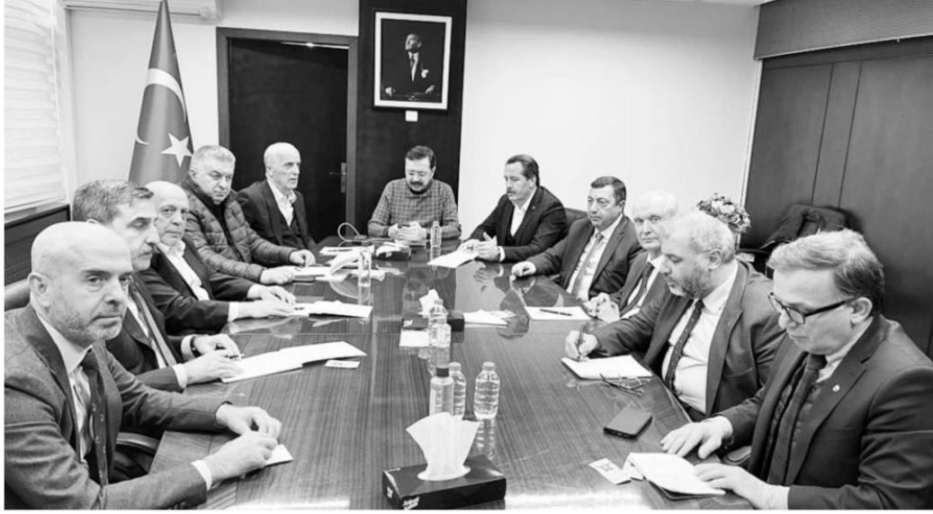
Yaklaşık 5 saat süren toplantı sonucunda, deprem bölgesinde ekonominin ve istihdamın yeniden canlandırılması için 5 projenin hayata geçirilmesi konusunda görüş birliğine varıldı.