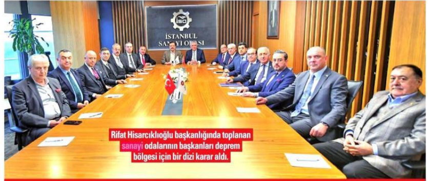
Rifat Hisarcıklıoğlu başkanlığında toplanan sanayi odalarının başkanları deprem bölgesi için bir dizi karar aldı.

■ E-TİCARETTE POZİTİF AYRIM: TOBB e-Ticaret Sektör Meclisi kanalıyla başlatılan pazar yerlerinin, deprem bölgesindeki firmalardan tüketiciye ulaştırılacak ürünler için komisyon almaması uygulaması sektör genelindeki tüm firmalara yaygınlaştırılacak. Bölgedeki üreticiler ön pla-