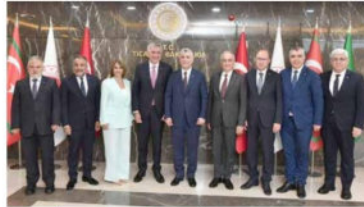
Prof. Dr. Ömer Bolat @omerbolatTR