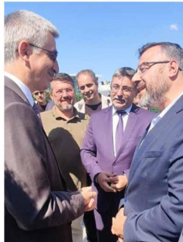
Lokman Koyuncuoğlu @lkoyuncuoğlu

Eğitimde kalite çitasını hep yükselten başarılı isimler @yilmaznazif @ahmeterol4242 @avcimehmet42