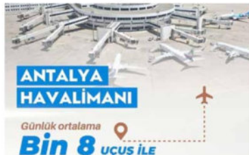
Abdülkadir URALOĞLU @a_uraloglu

Adalet Bakanımız Sayın @yilmaztunc Azerbaycan Yüksek Mahkeme Başkanı Sayın İnan Karimov ve beraberindeki heyeti kabul etti. https://adalet.gov.tr/adalet-bakani-tunc-azerbaycan-yuksek-mahkeme-baskani-karimovu-kabul-etti