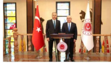
T.C. Milli Savunma Bakanlığı @tcsavunma

Milli Savunma Bakanı Yaşar Güler, "Hayırlı olsun." ziyareti gerçekleştiren İçişleri Bakanı Ali Yerlikaya ile Milli Savunma Bakanlığında bir araya geldi. #MilliSavunmaBakanligi #YaşarGüler