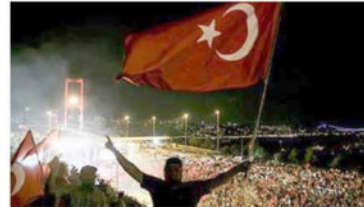
Ali Yerlikaya @AliYerlikaya

HAZİRAN AYINDA FETÖYE YÖNELİK OPERASYON GERÇEKLEŞTİRİLDİ Geçen ay kendi halkına silah sıkan, eli kanlı terör örgütüne yönelik düzenlenen operasyonlarda; 748 şahıs gözaltına alındı. 130 şahıs tutuklandı. 15 Temmuz hain darbe girişiminde bulunan FETÖ'ye yönelik operasyonlarımız aralıksız sürüyor. Jandarmamız ve Emniyetimiz tebrik ediyorum TERÖR ÖRGÜTLERİNE YÖNELİK MÜCADELEMİZ AZİM VE KARARLILIKLA DEVAM EDECEK #TürkiyeninHuzuru