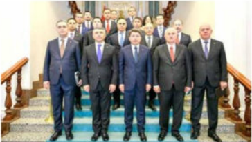
T.C. Adalet Bakanlığı @adalet_bakanlik