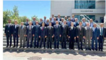
Mustafa Kavuş @MustafaKavus

Önceki dönem Çevre, Şehircilik ve İklim Değişikliği Bakanımız, İstanbul Milletvekili @murat_kurum ile Konya Milletvekillerimizi Gazi Meclisimizde ziyaret ettik. Rabbin, şehrimiz ve ülkemiz için hayırlı hizmetlerde bulunmayı nasip etsin.