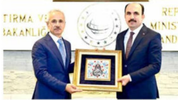
Uğur İbrahim Altay @u_ibrahim_altay

Konya heyeti olarak Ulaştırma ve Altyapı Bakanımız Sn. Abdülkadir URALOĞLU Bey'i ziyaret ettik. Bu vesileyle bir kere daha Sn. Bakanımıza muvafakiyetler diliyorum.