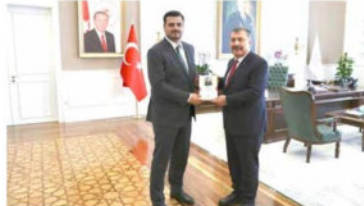
Dr. Fahrettin Koca @drfahrettinkoca