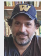
PROF. DR. EVREN BOLGÜN BEYKÖZ ÜNİVERSİTESİ

"Merkez Bankası'nın 2023 sonu ve 2024 yılı için açıkladığı hedeflerin dışında bir enflasyon patikasına girildi. Haziran ayında enflasyondaki düşüş bizi şaşırtmasın. Çünkü kurlardaki yükselişin enflasyona yansımaları çok düşük gözüküyor. Önümüzdeki aylarda kur artışının bu seviyelerde kalması veya daha yüksek seviyeleri görmesi durumunda, döviz kurundaki artışın enflasyona yaklaşık yüzde 10 ila 15 arasında bir etkisi olacak. Böylelikle yıllık enflasyon yıl sonunda yüzde 50'lere dayanacak. Döviz kurundaki problemi çözemediğimiz sürece, enflasyon sorununu da kısa vadede ya da orta vadede çözmemiz mümkün değil."