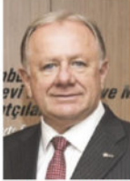
ADİL PELİSTER İKMİB

ham maddesi olan petrol ve petrokimya fiyatlarındaki gelişmeler, AB ülkelerindeki resesyon ve durgunluk, Rusya-Ukrayna savaşının enerji piyasasına etkisi, faiz ve enflasyon gibi olumsuz etkilere rağmen yıl sonunda 35 milyar doların üzerine çıkmayı hedefliyor.