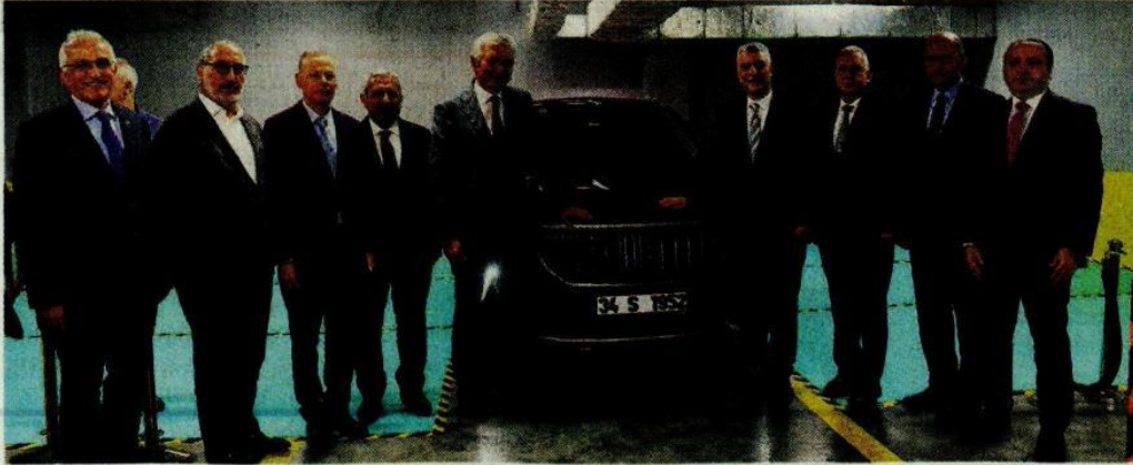
Ticaret Bakanı Ömer Bolat, ISO Yönetim Kurulu Başkanı Erdal Bahçıvan ve ISO Meclis Başkanı Ender Yılmaz ile birlikte TOBB tarafından ISO'ya teslim edilen Togg'u inceledi. Bolat, Ticaret Bakan Yardımcıları ve ISO yönetimi, Togg ile hatıra fotoğrafı çekti. Togg'un plakasında yer alan 1952, ISO'nun kuruluş yılını sembolize ediyor.

“Hedefi olmayana rüzgar yardım etmez” diyen Ticaret Bakanı Ömer Bolat, beş yılda mal ihracatının 400 milyar dolara, hizmet ihracatının da 200 milyar dolara yükseltilmesinin planlandığını açıkladı