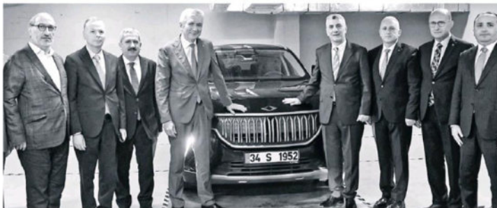
Ticaret Bakanı Ömer Bolat, toplantı sonrası İSO Başkanı Erdal Bahçivan ve İSO Meclis Başkanı Ender Yılmaz ile birlikte TOBB tarafından İSO'ya teslim edilen TOGG'u inceledi.

yoğun çalışmakta. Eylülün ilk yarısında yeni OVP'yi paylaşacağız" dedi. Türkiye ekonomisinin küresel düzeyde yaşanan tüm bu olumsuzluklara ve şubat ayında yaşanan deprem felaketine rağmen 2023'ün ilk çeyreğinde yüzde 4 büyüme başarısı gösterdiğine dikkat çeken Bakan Bolat, "İkinci çeyrekte de bu rakama yakın bir büyüme bekliyoruz" diye konuştu.