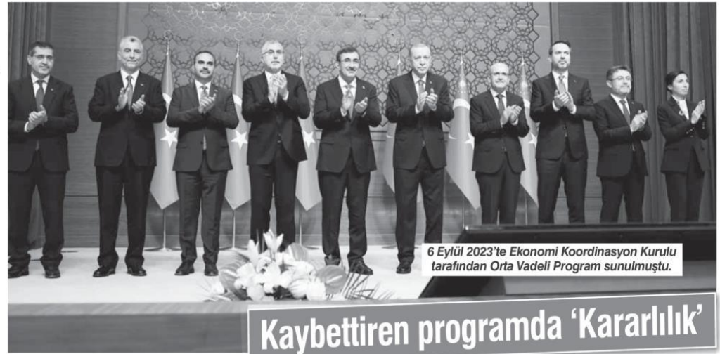
6 Eylül 2023'te Ekonomi Koordinasyon Kurulu tarafından Orta Vadeli Program sunulmuştu.

■ Mart ayında; TÜİK'in tüketicilerin maddi durum ve genel ekonomiyi ilişkin mevcut durum değerlendirmeleri ile gelecek dönem beklentileri, harcama ve tasarruf eğilimlerini ölçmek amacıyla ha-