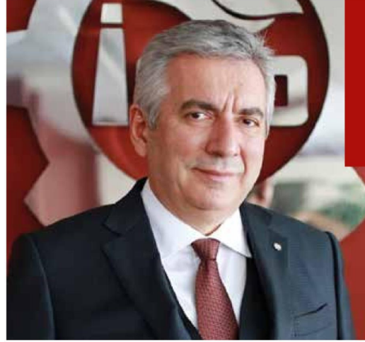
ISO Yönetim Kurulu Başkanı

Önümüzdeki dönemde de ihracatçı sanayimizin en güçlü iş ortağı olmaya devam edecek olan Türk Eximbank'ın, ihracatımızın daha da gelişmesi ve sorunsuz işlemesinin sağlanması için sermaye yapısı güçlendirilmelidir. Şu anda Eximbank, Türk bankacılık sisteminde ihracat odaklı çalışan sanayicilerin en önemli finansman ayağı. 2000'li yılların başında 30