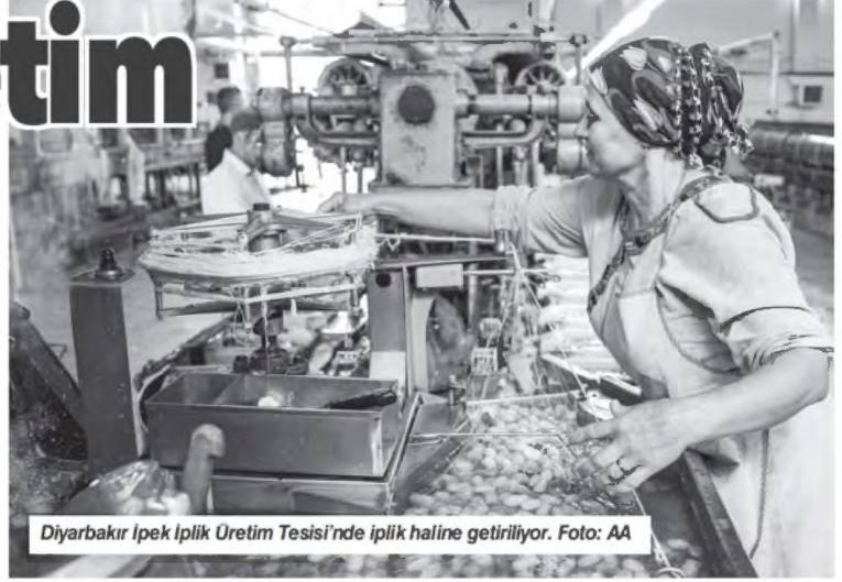
Diyarbakır İpek İplik Üretim Tesis'i'nde iplik haline getiriliyor.

Yıllık bazda üretimde hızlı artış olsa da aylık serideki zafiyet dikkat çekti. Yılın ilk altı ayında da sanayi üretimi tarafından büyümeye destek gelmemiştir. Yüksek faiz politikası çarkları durdurmaya başladı