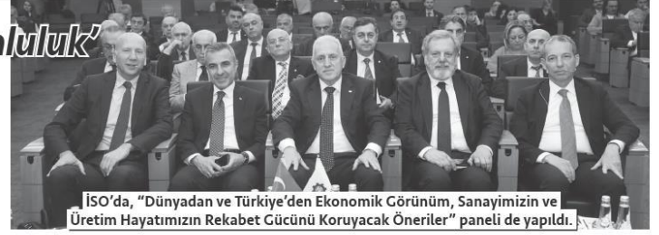
İSO'da, "Dünyadan ve Türkiye'den Ekonomik Görünüm, Sanayimizin ve Üretim Hayatımızın Rekabet Gücünü Korumaya Öneriler" paneli de yapıldı.

vadeli etkileri başlığında göstermek durumundayız. Bunun başında sanayimizin rekabet gücünü korumak geliyor. Türkiye'nin enflasyonla mücadeleyi bir kenara koymak gibi bir lüksü bulunmuyor. Bu süreçte üretim altyapısında kalıcı hasar yaşama lüksü de yok. Ayrıca Türkiye, bu süreçten üretim, lojistik, enerji yolları, finans gibi birçok başlıkta küresel önemini artırarak çıkmak konusunda büyük potansiyel taşıyor. Bu doğrultuda Türk sanayisinin üretim ve rekabet gücünü korumak ve artırmak hem ekonomik hem stratejik bir zorunluluk."