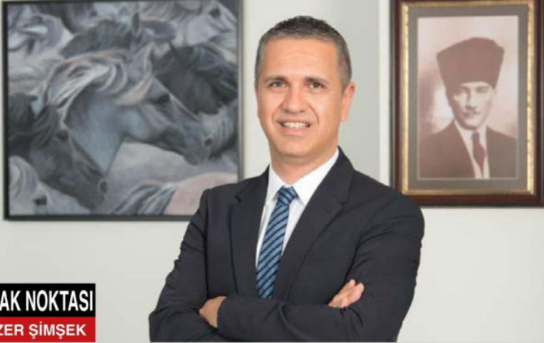
ODAK NOKTASI ÖZER ŞİMŞEK

Talep yönlü enflasyon, talebin arzdan yüksek olması olarak tanımlanır (Örneğin, Pandemi kapanma döneminde perakende ürünlerinin tüketiciler tarafından stoklanması gibi). Arz yönlü enflasyonu ise, potansiyel talep aynı iken, herhangi bir nedene bağlı olarak arzın düşmesi olarak açıklayabiliriz (örneğin Pandemi sürecinde ortaya çıkan çip krizinden dolayı otomobil üretim adetlerinde düşüş gibi). Sanırım diğer nedenler, içeriklerinden gayet açık bir şekilde anlaşılıyor. Merkez Bankası’nın para arzındaki yani emisyon hacmindeki artışın bugün yaşadığımız enflasyona olumsuz etkisi sınırlı. Yani burada “devlet ödemelerini yapmak üzere para basmak zorunda kalyor, para bastıkça da enflasyon ortaya çıkıyor.” gibi bir kısır döngüden söz edemiyoruz. 2024 yılının ilk çeyreğinde sonuna yaklaştığımız bugünlerde arz yönlü bir enflasyon gereksinimin ortadan kalktığını görüyoruz. Ancak talep yönlü enflasyon