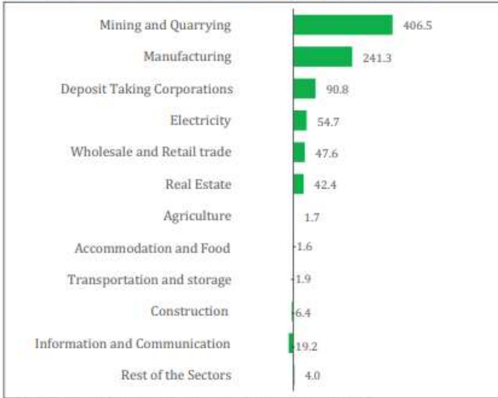
Foreign Direct Investment Liability Inflows by Sector (US$ million), 2020