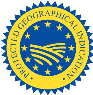
Şekil 2- PDO ve PGI logoları

510/2006/EC sayılı, Tarım ürünleri ve gıda maddelerinde mahreç işaretlerinin ve menşe adlarının korunması hakkında Tüzük