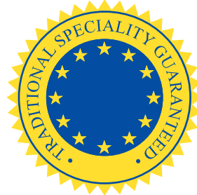
Şekil 1- TSG logosu 509/2006/EC sayılı, Geleneksel özellikli tarım ürünleri ve gıda maddelerinin garanti altına alınmasına ilişkin Tüzük

Tescil edilen bir geleneksel özellikli ürün adını kullanım hakkı, yalnızca başvuruyu yapan gruplarla sınırlı kalmıyor, söz konusu adın ilişkili olduğu tarım ürününü pazarlayan her işletmeci bu adı kullanabiliyor. Ancak, ürünün TSG olduğunu belirtmek ve ilgili logoyu kullanabilmek için başvuruda belirtilen gerekli şartları karşılamaları gerekiyor. Öte yandan, TSG olarak tescil edilen ada sahip bir ürünü ilk defa üretecek olan üretici, bu durumu ülkesindeki yetkili kurumlara bildirmekle yükümlü.